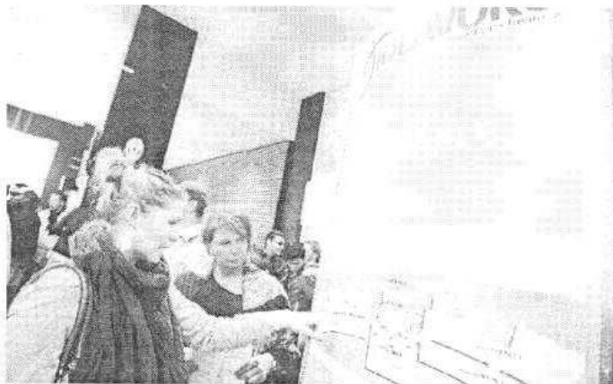
Dai dati Inps buone notizie per i giovani in cerca di lavoro

Oltre 1,15 milioni di nuovi contratti fissi (tra assunzioni e stabilizzazioni) hanno usufruito dell'esonero contributivo e c'  il rischio, paventato dai sindacati, che l'anno prossimo ci sia un rimbalzo negativo sulle assunzioni a causa della stretta sugli sgravi. «La crescita dell'occupazione   dopata dagli sgravi - sottolinea alla Cgil - Renzi sbaglia, la ripresa non c' . La Uil parla di «metadone» e chiede al Governo politiche che promuovano la crescita ad oggi «fragile, debole e a tempo determinato».